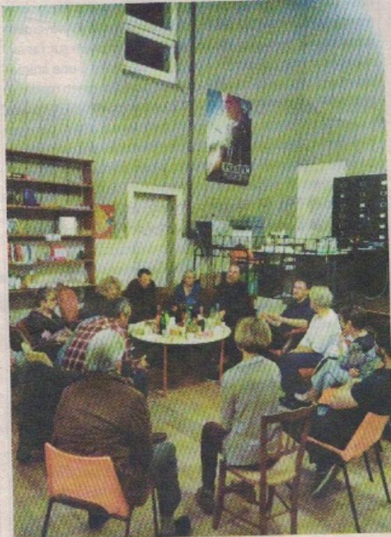
Une quinzaine de participants lors du premier apéro philo.